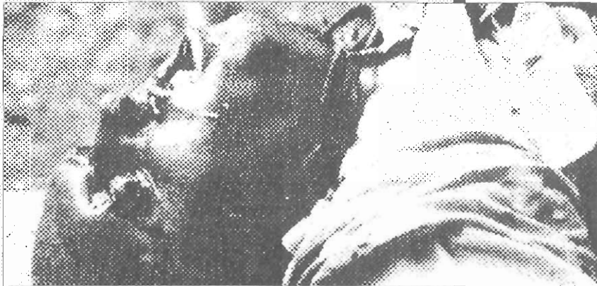
Jedna od žrtava masakra u Dalju One of victims from village Dalj massacre

Tog sparnog nedjeljnog poslijepodneva smrad pokvarenog mesa i životinjskih lešina lebdio je nad opustjelom Hrvatskom Kostajnicom. Desetak dana ranije, nakon paničnog bijega stanovnika hrvatske nacionalnosti (Srbi su otišli već ranije) mnogo je mesa ostalo u zamrzivačima, a zatim je nestalo struje. Mnogo stoke ostalo je u štalama, bez ikoga da se o njima brine. Rezervisti hrvatskog MUP-a koji su ovdje stacionirani govore nam kako se stvari sada već vraćaju u normalu. Prethodnih nekoliko dana vršena je dezinfekcija i zakapane su lešine i pokvareno meso. "Dobili smo naredenje da pobijemo mačke i pse koji su poludivlji lutali naokolo, jer prijetila je opasnost od bjesnoće. Jučer smo oko petnaest minuta raspravljali da li da ubijemo jednu krasnu žutu mačkicu koja se umiljavala oko naših nogu; na kraju smo ipak pucali." Policajci-rezervisti, čija je jedinica ovdje stacionirana, dignuti su iz kreveta u ranu zoru desetak dana ranije, da bi se već za pola dana našli na ratištu. Spontana prijaznost kojom su dočekali nas, dvoje litalica, i spremnost kojom su stupali u razgovor, vrlo brzo čini besmislenim priče o fanatičnim ustaškim koljačima, kakve ćemo imati prilike čuti dan kasnije, s druge strane rijeke Une. Oboje smo među njima pronašli i svoje školske kolege. Bezbroj puta smo, drugima, objašnjavali tko smo i kako smo ovamo došli, i zašto. Redovna reakcija bila je radost i odobravanje naših težnji, iako često uz sumnju u njihovu djelotvornost.